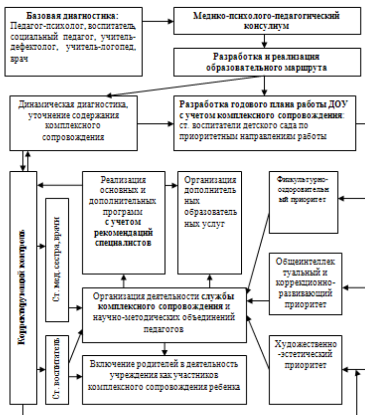
Схема взаимодействия специалистов

Работой по образовательной области « Речевое развитие » руководит учитель-логопед, а другие специалисты подключаются к работе и планируют образовательную деятельность в соответствии с рекомендациями учителя-логопеда.